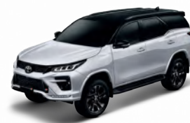
WHITE PEARL CS BLACK TOP