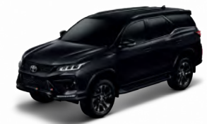
ATTITUDE BLACK MICA