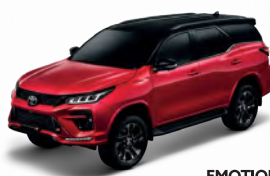
EMOTIONAL RED BLACK TOP